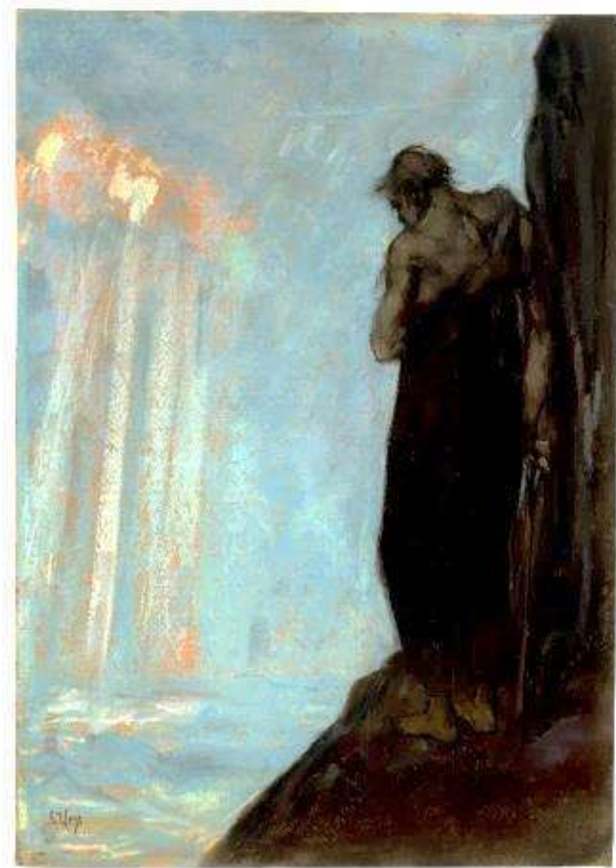
Lesser Ury – Mozes ziet vanaf de berg Nebo uit over het beloofde land. - pastel op karton, 1928 - Joods Museum Berlijn